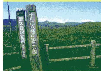
源太森からの展望

茶臼岳、裏岩手縦走コース上の釜岳とともに八幡平三大展望地に数えられるだけに山頂からの展望はみごと。