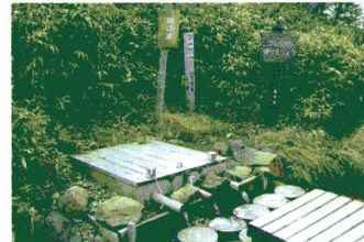
上/池塘の点在する黒谷地湿原 中/花咲く黒谷地湿原 下/湿原下部の熊の泉