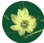
上/タカネバラ 下/キヌガサソウ