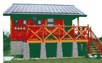
上/茶臼岳からの夜沼 下/茶臼山荘