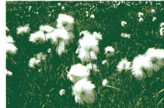
上/八幡平最大の湖沼・八幡沼 中/沼畔に建つ陵雲荘 下/ワタスゲ